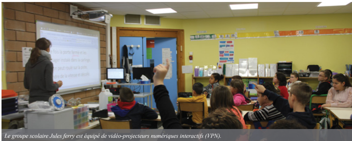
Le groupe scolaire Jules ferry est équipé de vidéo-projecteurs numériques interactifs (VPN).

Le lundi 2 septembre, les élèves Villards reprennent le chemin de l'école après la pause estivale. Pour cette rentrée, la ville poursuit les démarches entamées : dédoublement des classes, développement du numérique, et rénovation des groupes scolaires.