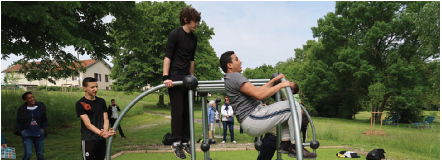
Les jeunes ont pu tester le module de parkour à l'occasion de l'inauguration du parcours le 18 mai dernier, avec les conseils de l'école de parkour.

Le 18 mai dernier, la ville inaugurait la suite du parcours sportif plein-air débuté en 2015.