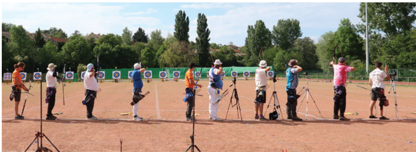
Compétition de tir à l'arc le 25 mai 2019, au stade Lionel Terray de Villefontaine.