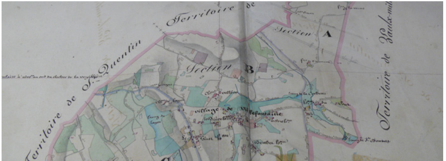
Extrait du cadastre de 1839, conservé aux archives départementales de Grenoble.

Il ne reste presque plus de traces de la maison-forte du Layet, seul édifice fortifié de Villefontaine. Elle faisait face au château de Fallavier et devint, au fil du temps et des aménagements, le château du Layet.