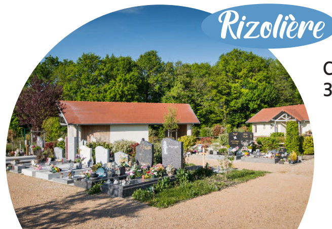
Chemin de la Rizolière, 38090 Villefontaine