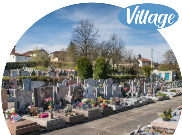
« Le Village » rue du 8 mai 1945 38090 Villefontaine