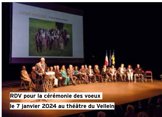
RDV pour la cérémonie des vœux le 7 janvier 2024 au théâtre du Vellein