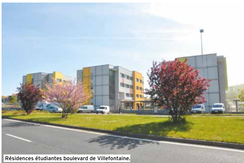
Résidences étudiantes boulevard de Villefontaine.