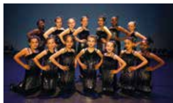
Gala du 3 juin 2023, au théâtre du Vellein, thème le 7 e art : « L'ADV fait son cinéma ! ».

https://www.facebook.com/LArtistiqueDanseDeVillefontaine/