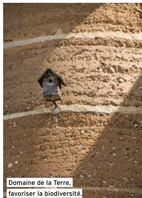
Domaine de la Terre, favoriser la biodiversité.