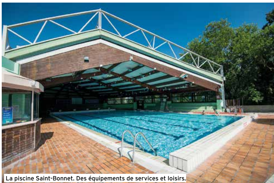
La piscine Saint-Bonnet. Des équipements de services et loisirs.