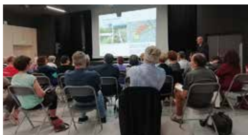
Réunion publique d'information, en présence de Monsieur le Maire.

C'est dans ce cadre contraint que les grandes orientations ont été définies par l'équipe municipale, portées à la connaissance des Villards lors de 4 réunions publiques et un mois d'enquête publique, dans les documents réglementaires du PLU.