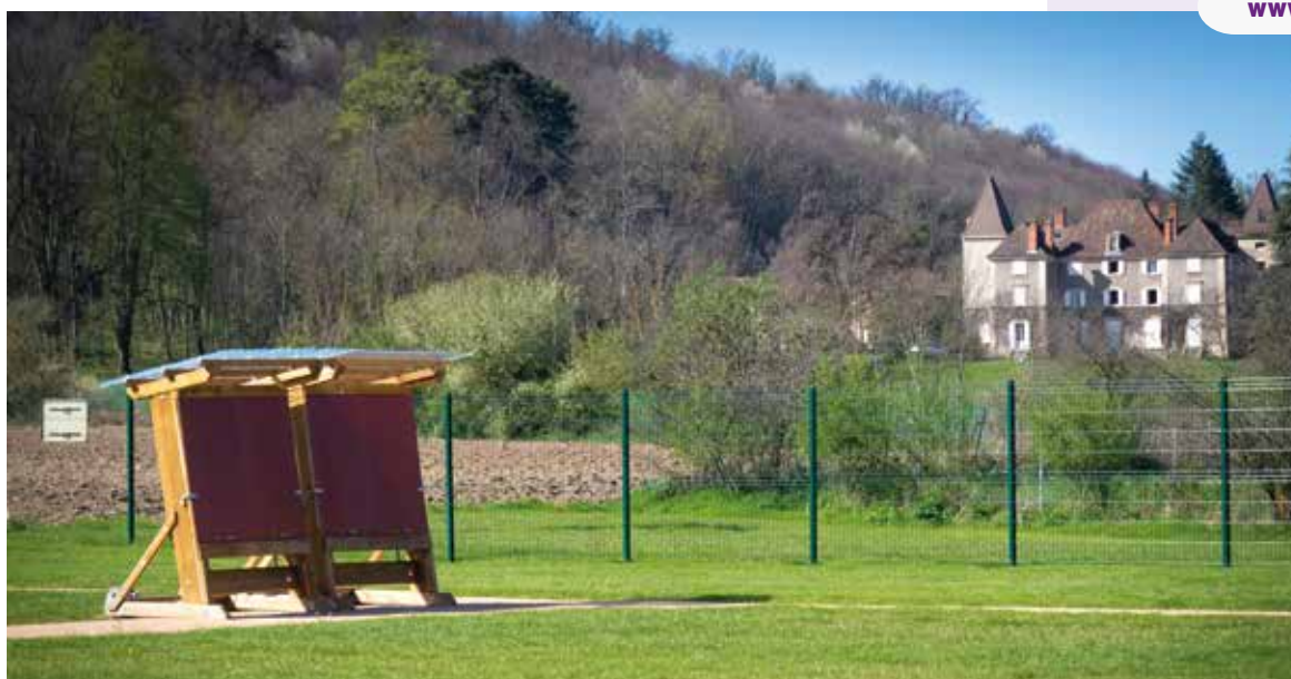
Le pas de tir communal, extérieur permanent, équipé de 12 cibles pour s'entraîner à tirer de 20 à 70 mètres.