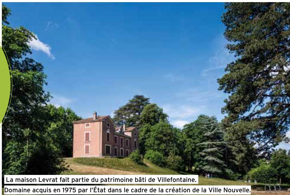
La maison Levrat fait partie du patrimoine bâti de Villefontaine. Domaine acquis en 1975 par l'État dans le cadre de la création de la Ville Nouvelle.