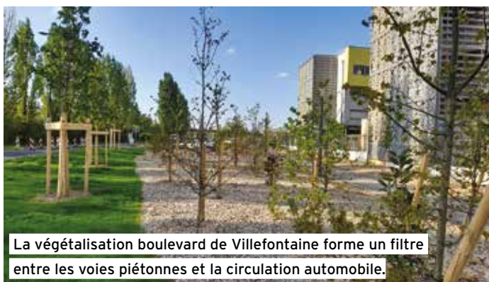
La végétalisation boulevard de Villefontaine forme un filtre entre les voies piétonnes et la circulation automobile.