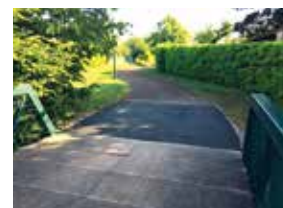
Travaux de reprise des seuils de la passerelle de la Maladière.