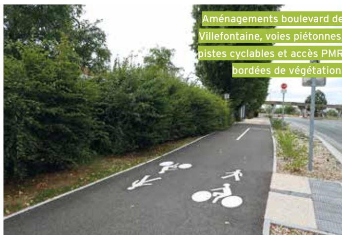
Aménagements boulevard de Villefontaine, voies piétonnes, pistes cyclables et accès PMR bordées de végétation.

Sur l'ensemble du territoire, le bâti qui présente un intérêt patrimonial est protégé et fait l'objet de prescriptions particulières pour maintenir ses caractéristiques patrimoniales. ■