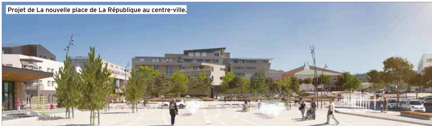
Projet de La nouvelle place de La République au centre-ville.