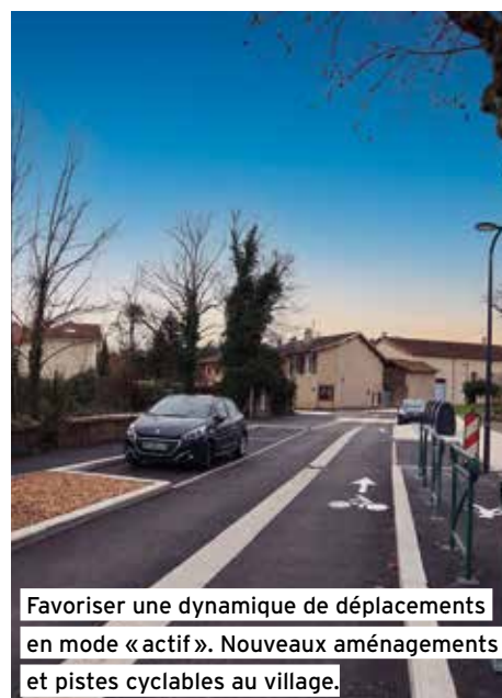
Favoriser une dynamique de déplacements en mode « actif ». Nouveaux aménagements et pistes cyclables au village.